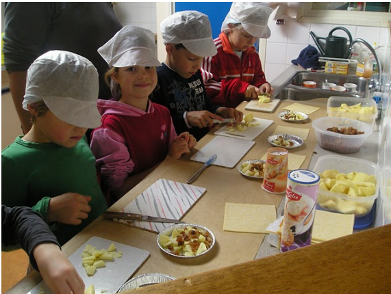
Ouderhulp: koken tijdens de Kinderboekenweek.

We zijn dankbaar dat we op veel steun van de ouders kunnen rekenen. Het is elk jaar weer bijzonder fijn om te zien dat u op veel terreinen uw steentje bijdraagt: schoonmaakavonden, Kinderboekenweek, leerlingenvervoer, pleinwerkmorgen, paasfeest, kerstfeest, schoolfeest, sportdag e.d. Zonder uw hulp zouden veel activiteiten niet mogelijk zijn.