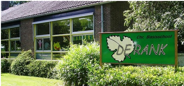
In juli 2010 kreeg de school een nieuw naambord